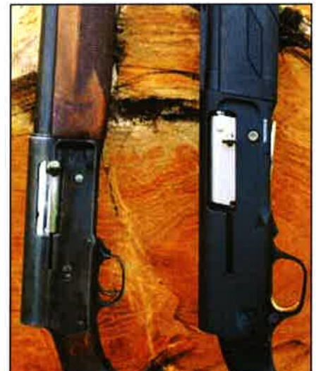
A két „Püpos”: balra az Auto 5, jobbra az A 5