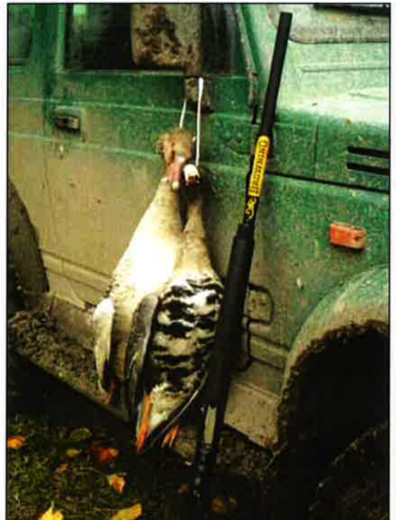
A cserélhető szűkítéssel a magasan repülő libákat is könnyen el lehet érni

emelt fel a csőtárból egy rugó által előretolt zártest elé, majd a töltényt a töltényűrbe betolva, újra mereven lezárta a csőfart. Az A 5 csőve – ellentétben elődjével – már nem mozog és a rendszer lelke a Kinematic Drive™-nak elkészített zártest, amelyet a lövés visszafelé ható mozgási energiája működtet. A zártest kényszerpályán vezérelt forgófeje négy reteszelő szemölcszel zár a csőfarban, ezáltal 40 százalékkal csökken a nyitási út hossza és közel 8-10 százalékkal az ismétlés időtartama. A Kinematic Drive™ rendszerű zártest megbízhatóságát az 500 ezer lövéses teszt bizonyította a legkülönbözőbb töltények felhasználásával! További kellemes újdonság a Speed Load Plus-nak nevezett, az Auto-5-höz képest módosított gyors töltési (és ürítési) rendszer. Itt a nyitott zárnál a töltényt a cső alatti tárba töltve és a zártestet a tok jobb