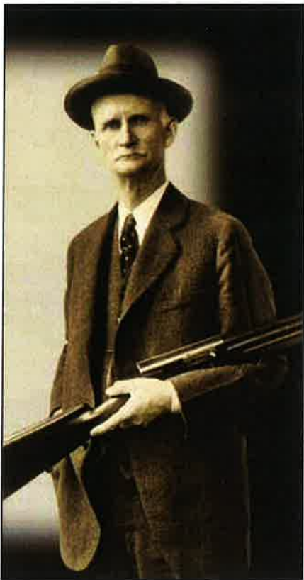
John M. Browning a „Púpossal”

Az Amerikai Egyesült Államok beli Utahból származó zseniális fegyverkonstruktor, John M. Browning nevéhez számtalan, mai napig előszeretettel használt fegyverkonstrukciós megoldás vagy lőfegyver fűződik. Vadászati hétköznapijaink elképzelhetetlenek bock puská vagy félautomata sörétes nélkül. A világ első félautomata sörétes szabadalmát, a Browning Auto-5-öt 1900-ban, több éves kísérletezést követően jelentette be az alkotókedvű amerikai feltaláló.